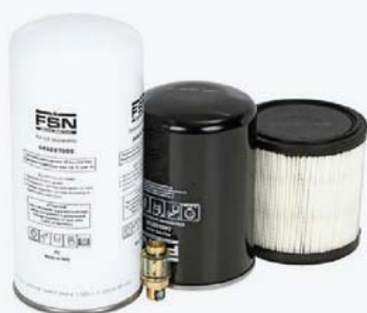
Комплект "Long Life" 4000 часов

Комплекты рассчитаны на 2000, 4000, 8000, 12 000 часов наработки и включают в себя все оригинальные запчасти и расходные материалы, подлежащие замене в соответствии с графиком технического обслуживания.