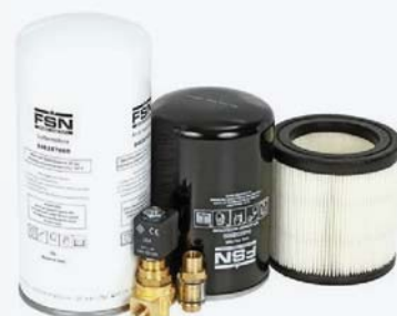
Комплект "Long Life" 12 000 часов