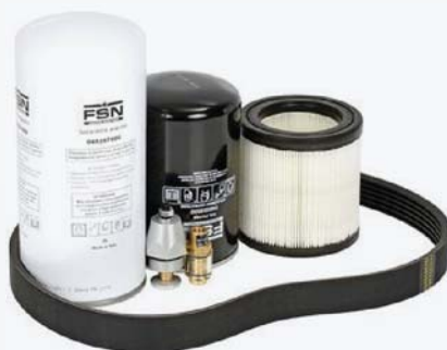
Комплект "Long Life" 8000 часов